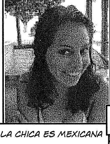
LA CHICA ES MEXICANA