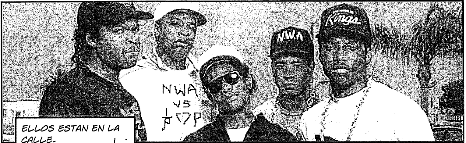
ELLOS ESTAN EN LA CALLE. L.