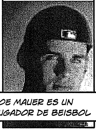
JOE MAUER ES UN JUGADOR DE BEISBOL