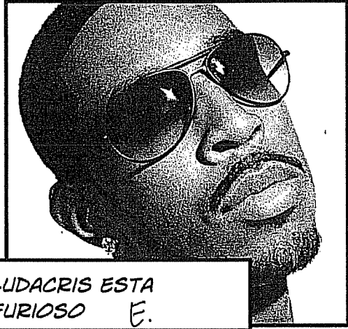
LUDACRIS ESTA FURIOSO E.