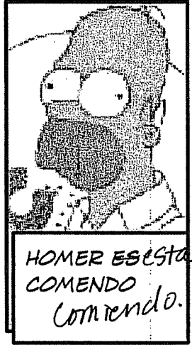
HOMER ES ESTA COMIENDO Comiendo.